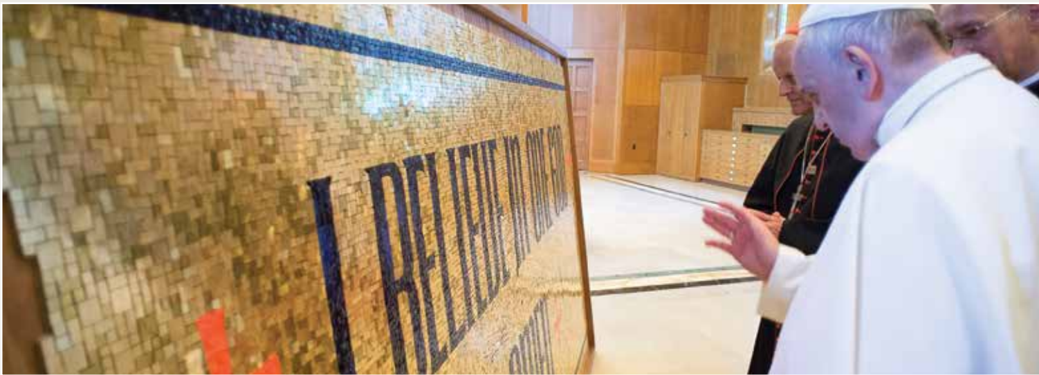
Pope Francis blesses the first segment of the Trinity Dome mosaic on his visit to the National Shrine in 2015. Papa Francisco bendice el primer segmento del mosaico de la cúpula de la Trinidad en su visita al Santuario Nacional en el año 2015.